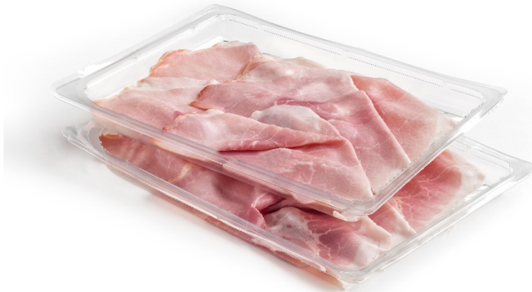
[Bild 3] Bildunterschrift/Quelle: EVAL EVOH-Barrierefolien von Kuraray ermöglichen ebenso nachhaltige wie effiziente Fleischverpackungen. (Quelle: Kuraray)